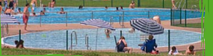
Mintxetako Igerilekua Piscinas de Mintxeta

PUNTO DE SALIDA: Punto de Acogida de Mintxeta, Elgoibar (Gipuzkoa). PUNTO DE LLEGADA: Punto de Acogida de Mintxeta, Elgoibar (Gipuzkoa). DESCRIPCIÓN DE LA RUTA: Es una ruta fácil de carácter familiar, que parte del punto de acogida de Mintxeta, donde se puede alquilar bicicletas, darse una ducha o lavar las bicis entre otros servicios como piscinas, gimnasio y pistas de atletismo. La ruta nos lleva hasta la ermita de San Lorenzo donde podremos hacer un descanso en el área recreativa antes de volver.